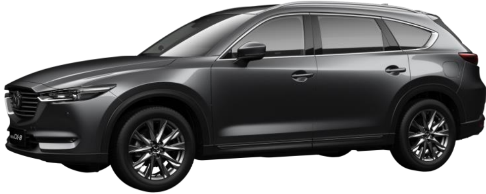
Platinum steel ash (1)