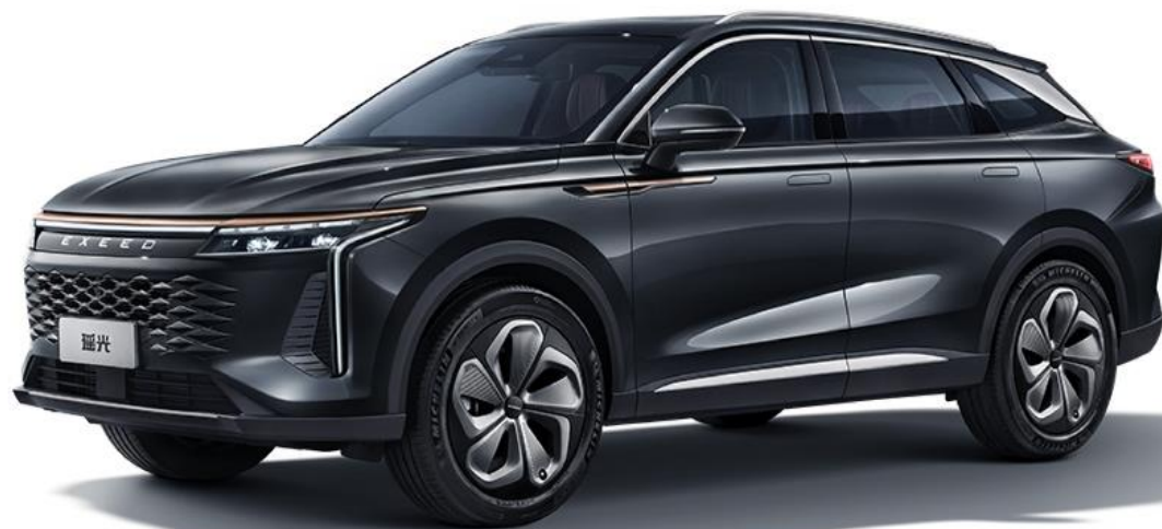
Swallow tail blue