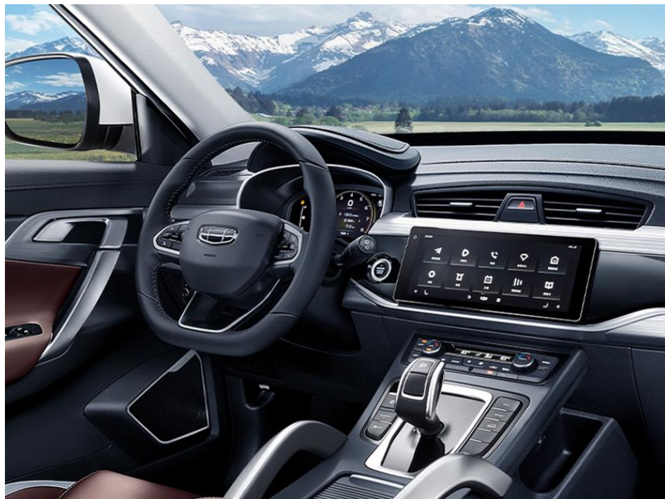
Салон: Beige brown two-tone light luxury interior